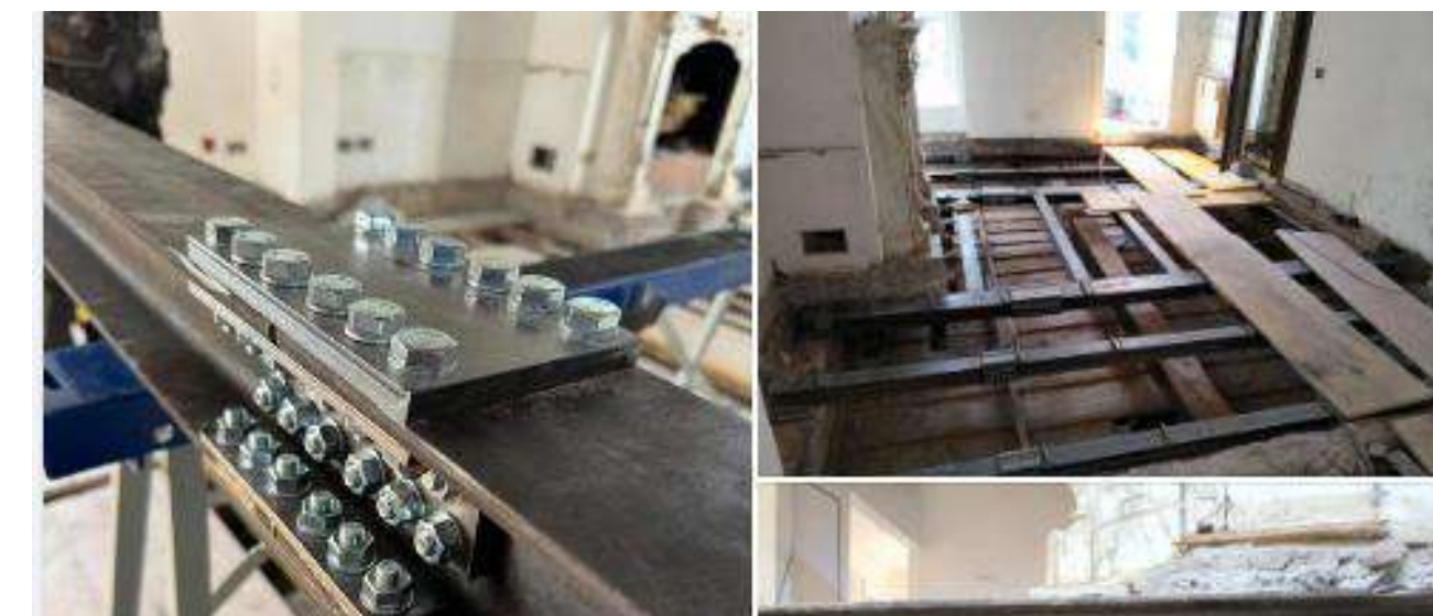
📍 Hotel in Via della Mercede Demolizione e costruzione nuovo solaio in acciaio