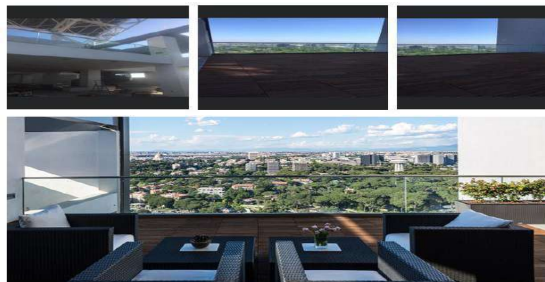
📍 Eurosky Tower, Eur Roma 2 Parapetto in vetro