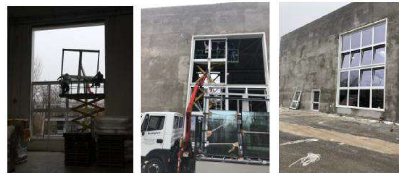
📍 Modena Capannone Industriale