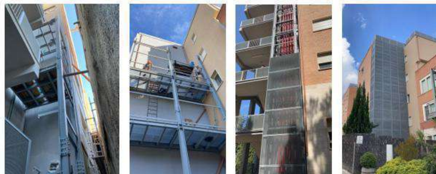
📍 Ospedale S. Pietro Fatebenefratelli Struttura metallica di Carpenteria pesante