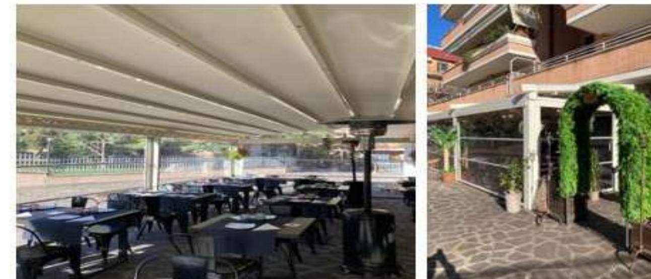
📍 Ristorante Eden Lab di Roma Pergotenda