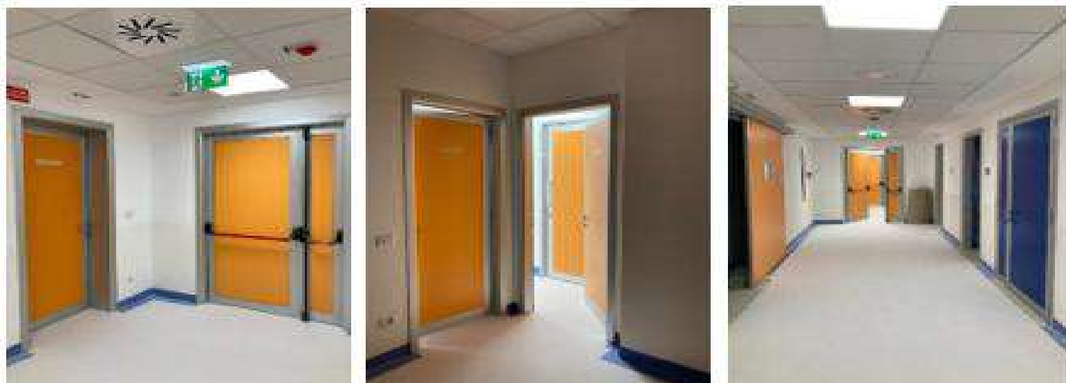
📍 Ospedale San Camillo di Roma Porte reparto Angiografia